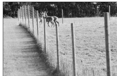
Poda Supernet til hjorte.

Veterinærdirektoratet har beskrevet hegnskrav til hjortefarme. Du kan få denne beskrivelse ved henvendelse hos Poda Hegn.