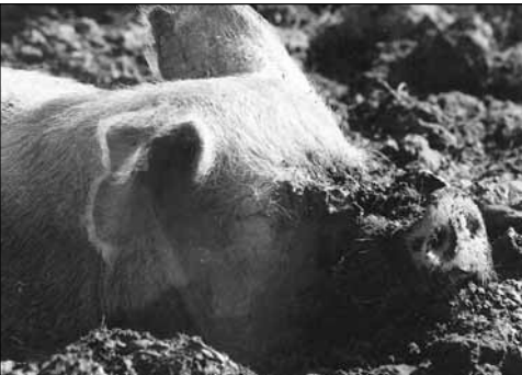
Søerne trives med et sølehul.

Husk at grisene er glade for et sølehul eller mudderhul, som de kan bade i under de varme sommermåneder.