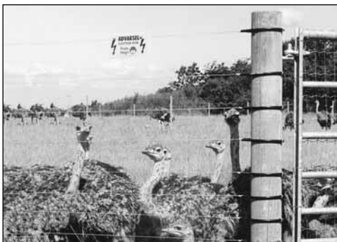
Hegn til strudsekyllinger: Ø8 x 200 cm pæle samt bat med 10 tråde. Færdigt hegn H: 150 cm.

Veterinærdirektoratet har beskrevet hegnskrav til strudse. Du kan få denne beskrivelse ved henvendelse hos Poda Hegn.