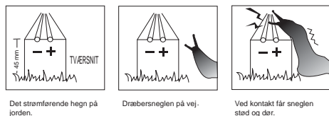
Det strømførende hegn på jorden.